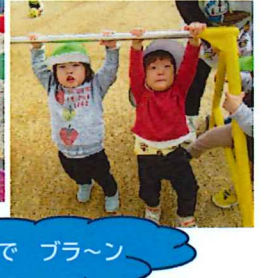
てつぼうで プラ〜ン