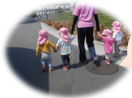
おてて つないで 散歩